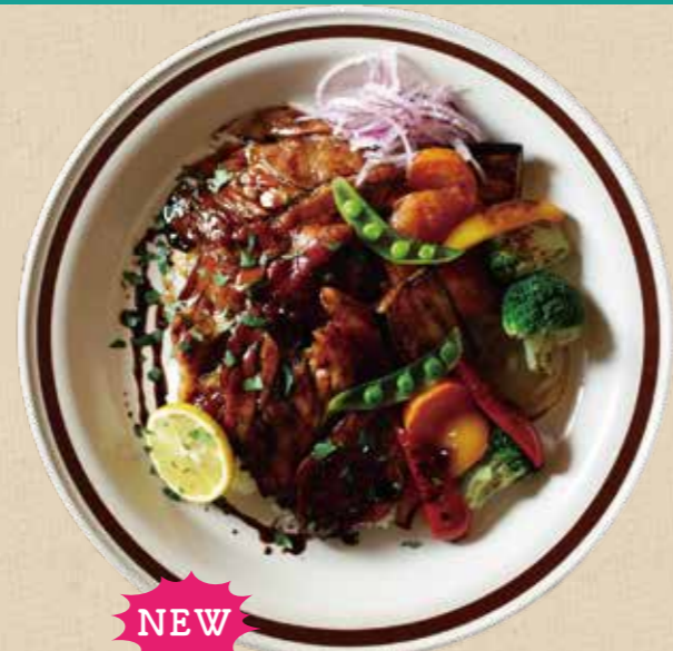
NEW 甘辛ポークライス 1,350 円