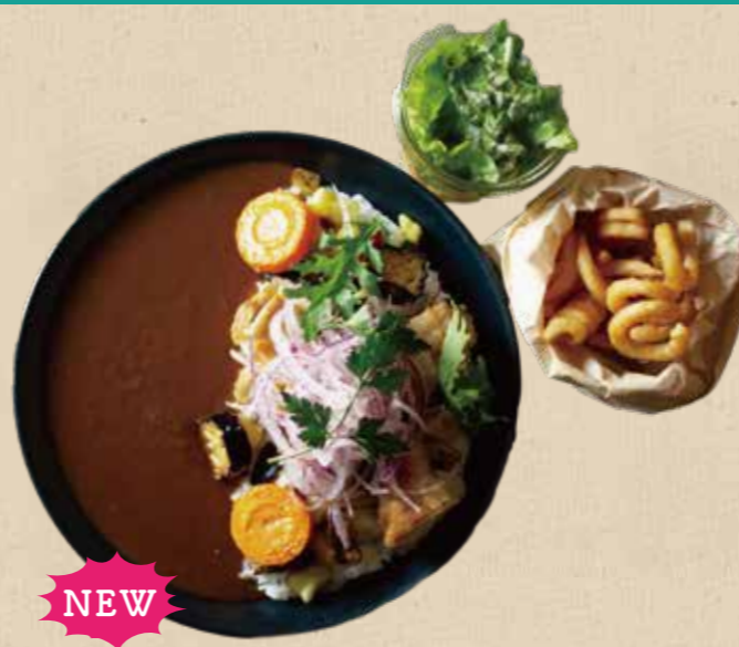
NEW たっぷり野菜カレー 1,280 円