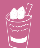
ミニパルフェ +250 円