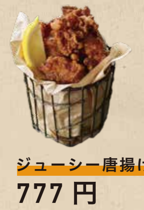
ジューシー唐揚げ 777 円