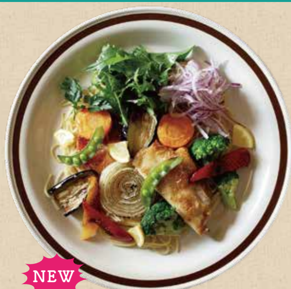
NEW 焼き野菜のグランピングパスタ 1,300 円

エイトパークカフェ プライムツリー赤池店のランチメニューがリニューアル！パスタとお肉の大皿プレート、手軽なオープンサンド、ガッツリワイルドなカレーライスがラインナップ！楽しい時間をお過ごしください。