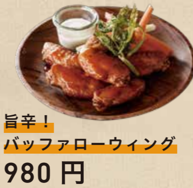
旨辛! バッファローウィング 980 円