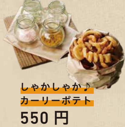
しゃかしゃか♪ カーリーポテト 550 円