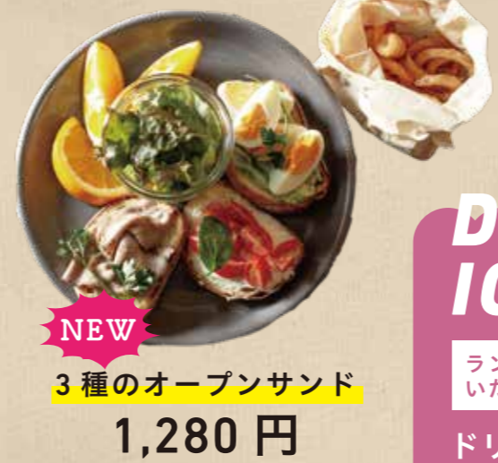
NEW 3種のオープンサンド 1,280 円