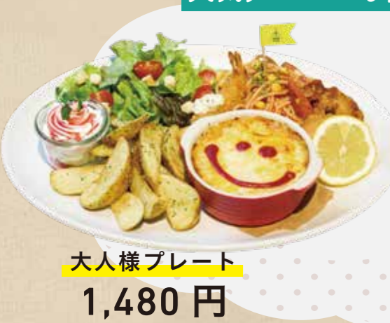
大人様プレート 1,480 円