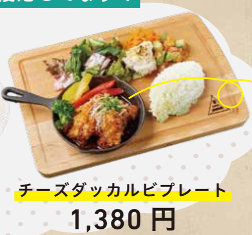
チーズダッカルビプレート 1,380 円